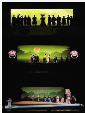
通中西”的教学探索,把教学成果的体现做到了极致。

毕业演出是一流本科专业建设的重要环节,教务处处长沈亮从这一角度出发分析了该剧成功的原因,认为导演在排练中吸取了国外一些先进的表演训练方法,并同上海传统的表演训练有机结合,突出了“守正创新,融