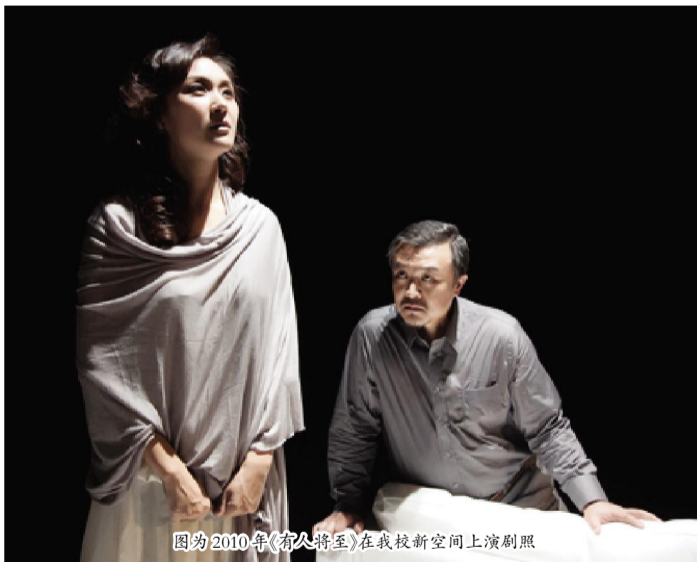
图为2010年《有人将至》在我校新空间上演剧照

约恩·福瑟是谁?一位挪威当代剧作家,一个有着卑微、快乐和不快乐生活的普通人,一个有着为人所知和从未听闻的故事的陌生人,一个生活在卑尔根这座充满阴霾的城市的男性。