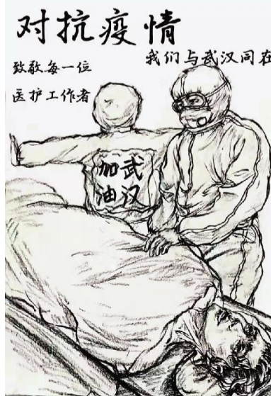
图为19舞台艺术师手工作品

拍摄完毕,我在回家的路上一直在回想刚刚看到的这一幕感人至深的片段,对我而言这是一次意外的收获,因为我开始只想到了拍摄回来的医护人员。这次我见到的不止有英雄的医护人员,也有默默守护英雄的亲属,这构成了一幅至美的人间图。