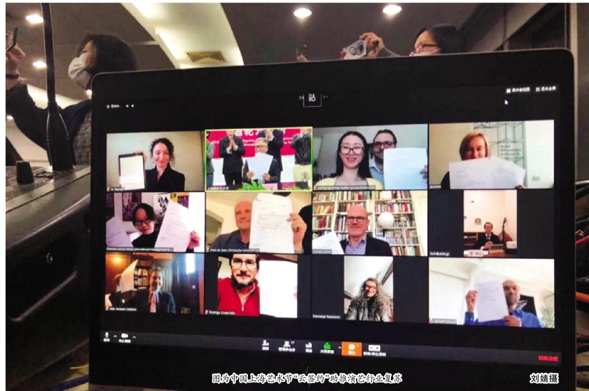
图为中国上海艺术节“云签约”助推演艺行业复苏

新冠肺炎引发的蝴蝶效应,让各行各业遭遇了不小冲击,同时也让演出市场遭遇“中场休息”。文艺演出属于精神文化消费,而非生活必需品。演出市场想要恢复到之前的水平,势必需要等到各行各业恢复正常以后,人们才有经济条件和剩余时间去走进剧场。在演艺链条上,演出商、剧场、票务等各个环节都受到猛烈冲击,