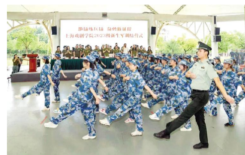
本报讯 9月15日,上海戏剧学院2023级本科新生圆满结束为期8天的军训。结营仪式于全民国防教育日前夕在东方绿舟营地举行。

同时,他寄语全校教师:着眼大局,从学校层面和国家层面担负起教师职责,践行教育强国、文化强国建设使命。树牢标准,坚持高线引领,坚守底线约束。重视传承,重视学校优良教学传统的传承,重视老中青教师经验的传承。